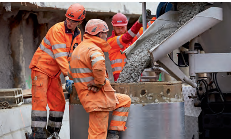
Betonieren eines Bohrpfahls für die Wand der Baugrube beim Hirschenpark.

Der Installationsplatz Hirschenpark unterhalb des Berner «Bierhübeli» dient als Ausgangspunkt für den Bau des Zufahrtstunnels zum neuen RBS-Bahnhof. Bevor der Tunnelvortrieb beginnen kann, gibt es noch einiges zu tun.