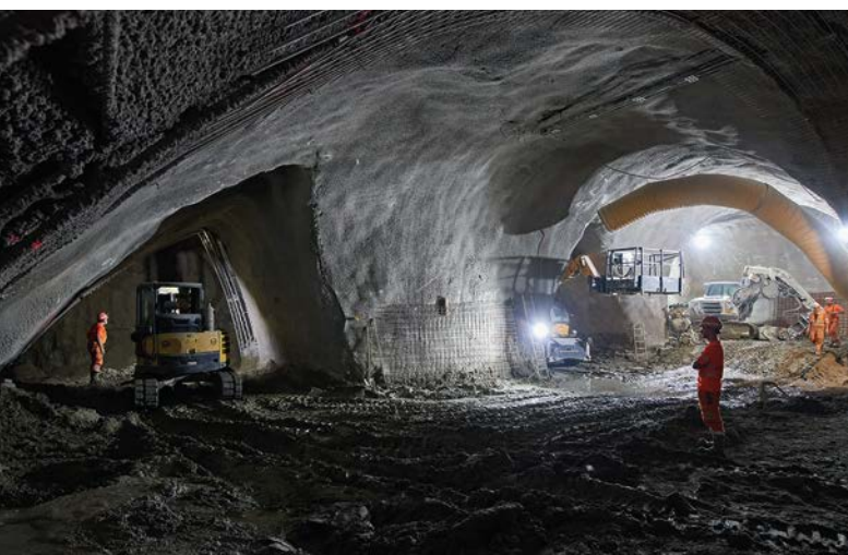
Ausbrucharbeiten für die Kavernen des künftigen RBS-Bahnhofs.

Der Zugang zur Baustelle erfolgt viel mehr über einen gut gesicherten Schacht über die Logistikplattform bei der Laupenstrasse, westlich des Bahnhofs. Dort, inmitten des Gleisfeldes, geht es senkrecht rund 20 Meter hinunter (zu Fuss oder mit einem eigens gebauten Lift), bevor der weitere Weg über einen schmalen Stollen weiter in die Tiefe unter die Gleise des Bahnhofs Bern führt – bis hin zur eigentlichen Baustelle. Und das, was hier wenige Meter unterhalb des pulsierenden Bahnhofs die nächsten Jahre bei laufendem Bahnbetrieb gebaut wird, ist nicht weniger beeindruckend als die fiktive Welt von Jules Verne: zwei gewaltige, unterirdische Hallen – sogenannte Kavernen, die parallel unter den Gleisen der SBB verlaufen und später den neuen RBS-Bahnhof bilden. Und diese Kavernen haben es in sich.